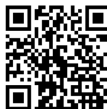
Sondage & programme complet

Ensemble, imaginons un projet qui profite à tous.